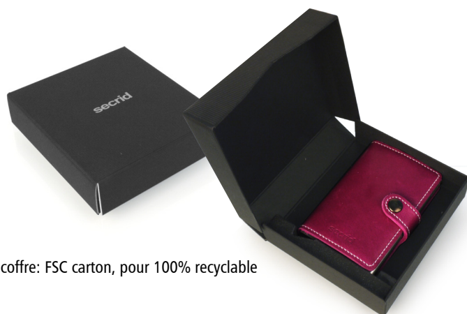
le coffre: FSC carton, pour 100% recyclable